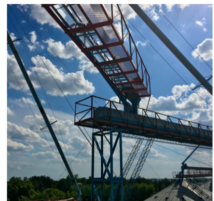
Plataformas y soportes